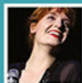
Florence Welch chanteuse « Florence + The machines »