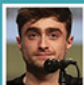
Daniel Radcliffe acteur interprète de «Harry Potter»

Source : orthophonie.comprendrechoisir.com/comprendre/dyspraxie et www.dyspraxies.fr/