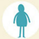
Podologue - posturologue