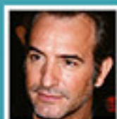
Jean Dujardin acteur de «The Artist»